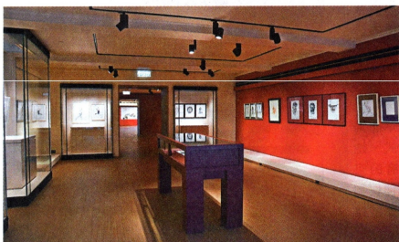
《一新時光：香港速寫》讓本地速寫作品濟濟一堂。