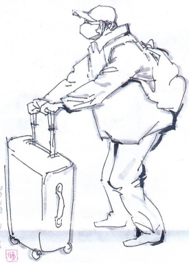
《人物動態速寫(二)》，鋼筆起稿，墨筆點綴。