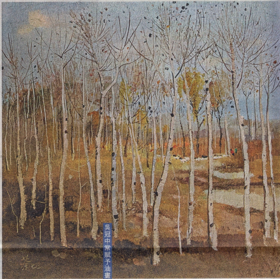
吳冠中帶風子油畫中國式的抒情，圖為1979年的作品《北國之秋》。

展覽只收錄華人藝術家的作品，就是由於中西方畫家的着眼點、作畫手法不同。楊春榮指，主要而言，中國畫的特點就是寫實，而西方就是抽象。「中國人喜歡對自然環境寫生，但中西方的寫生並不一樣，中國畫家想帶出的不是現實的客觀世界，而是作者的內心世界和精神，形成意境，例如一幅中國山水畫，可以既有太平山，又有獅子山，這個就是寫意境。而西方畫家則是畫實體，他們的抽象是將實體的形象模糊化，但都是客觀的，不同中國人的寫意境。」楊春榮補充，藝術家吳冠中亦是如此，畫中描繪不同的景色，從而帶出意境。