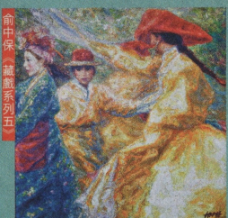
俞中保《藍紫系列五》

黃配江：1931年出生，自年輕時已熱愛繪畫，有不少知名的油畫、水墨畫作品，並對色彩、線條、空間都別有一番見解。黃配江曾舉行過多個展覽，在香港畫壇備受尊重。