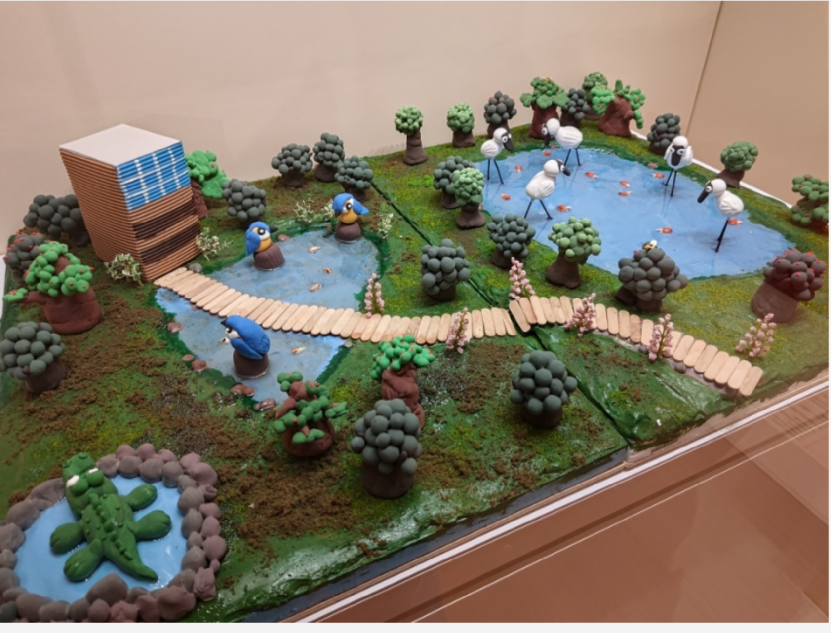
輕黏土作品《濕地公園》 圖：橙新聞

缺陷雖然限制了他們的行動，但無法限制他們的思維。沒有遮擋的海洋館，一起去旅行的漢堡和薯條，鱷魚住在雀鳥隔壁的濕地公園……每一件作品都彰顯著參展者的無窮想象力。參展者的背景各不同，包括智障、視障、聽障、肢體傷殘、自閉症、專注力不足/過度活躍症或有精神健康需要等人士。雖然他們各自面對不同的障礙，部分參展者還是初次接觸創作的藝術新人，卻同樣憑着勇氣及毅力克服困難，在各方照顧及關懷下，自強不息，發展自己的藝術潛能。