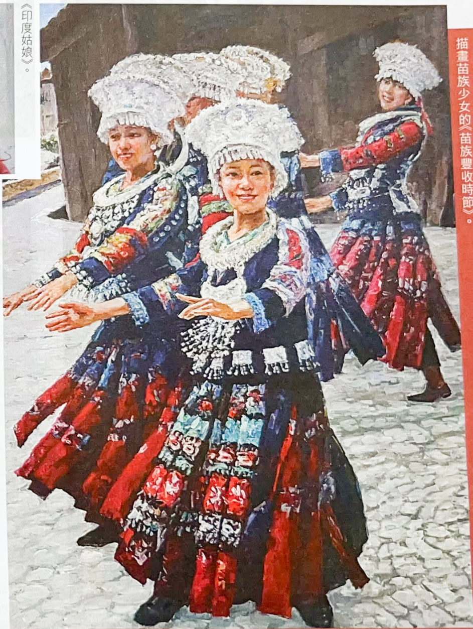
描畫苗族少女的《苗族豐收時節》。