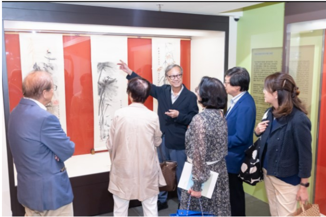
圖片 8 觀眾欣賞「嶺海風韻：饒宗頤與嶺南四君子合作畫」展覽。