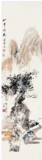
山市晴嵐 黎雄才、饒宗頤 水墨設色 1994