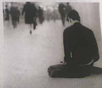
日本紀錄片導演原一男的出道作《再見CP》(1972)，記錄日本腦麻痺患者的日常生活，顛覆當時日本社會歧視殘疾人士的主流意識。