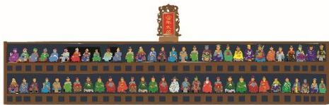
圖片五： 「三十六神明繪」展品