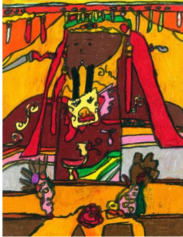
圖片四： 「三十六神明繪」展品