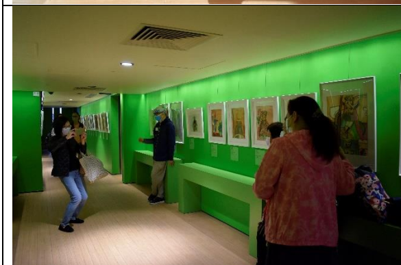
圖片三： 參展藝術家在「三十六神明繪」展覽留影。