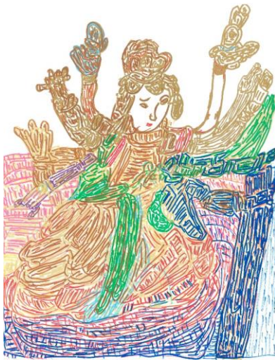
圖片六： 「三十六神明繪」展品