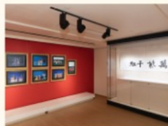
楊孫西書法及攝影