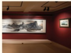
一清居臨二十世紀中國繪畫