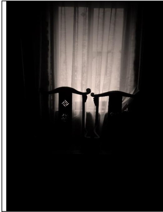
圖片八： 《翁狄森映意》展覽作品