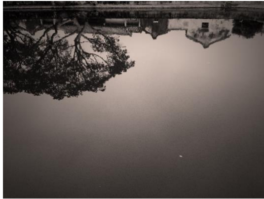
圖片九： 《翁狄森映意》展覽作品