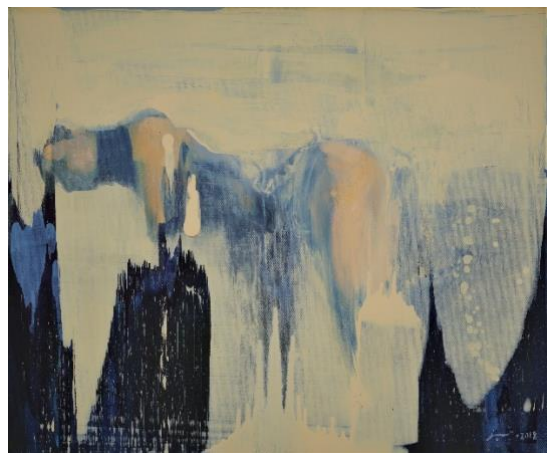
圖片六： 《廖井梅傲色》展覽作品