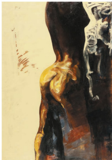
廖井梅作品《對峙》，2009年。