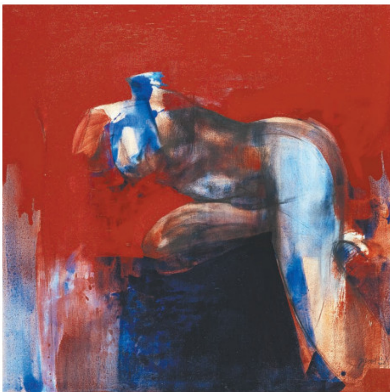
廖井梅作品《復歸》，2009年。