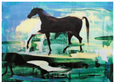
廖井梅作品《青海的記憶(四)》，2016年，畫家繪畫馬和人體是想表達矛盾的力量感。

出生於北京的廖井梅，1988年考入中央美術學院版畫系，後獲頒獎學金往蘇聯留學，並於莫斯科國立蘇里科夫美術學院取得藝術碩士學位，可見其藝術造詣高深。移居香港後，她曾因工作及家庭關係封筆10年，於2008年才重新繪畫，至此創作風格題材多元的作品。