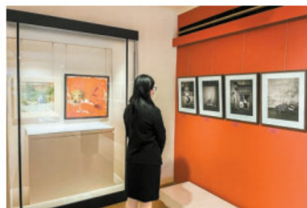
「翁狄森映意」攝影展與「廖井梅傲色」畫展同場展示。